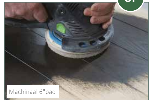
Machinaal 6" pad